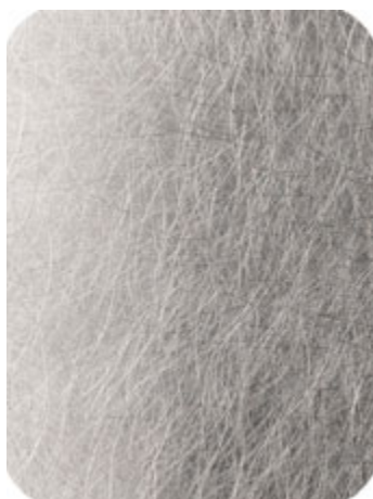
MV406-8200 sehr grob longline

Richtungslos geschliffen liefern wir sowohl in Edelstahl als auch Aluminium.