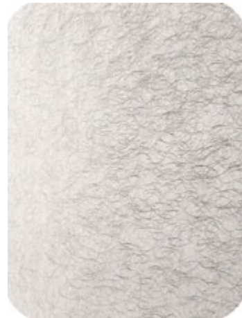
MV406-8100 sehr grob