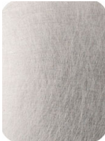
MV406-8000 grob longline