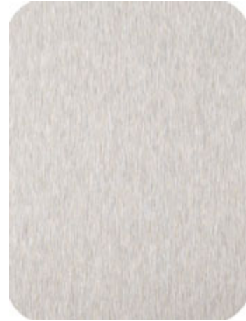
MV526 K320 geschliffen