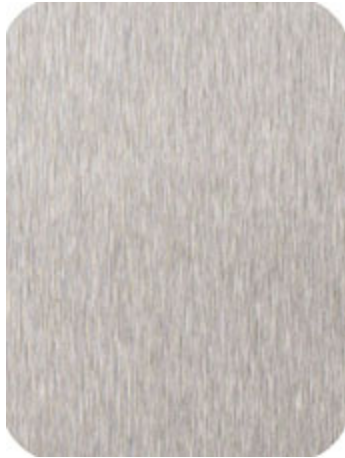
MV520 K180 geschliffen