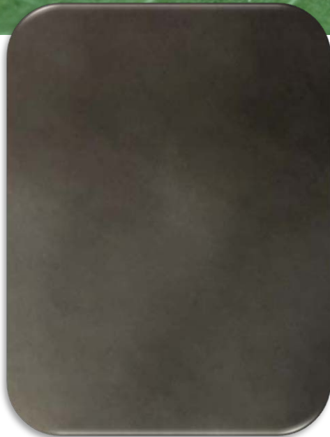
MV329 Black Patina Anti-Finger-Print / Easy-To-Clean