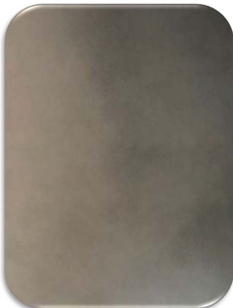
MV331 Champagne Patina Anti-Finger-Print / Easy-To-Clean