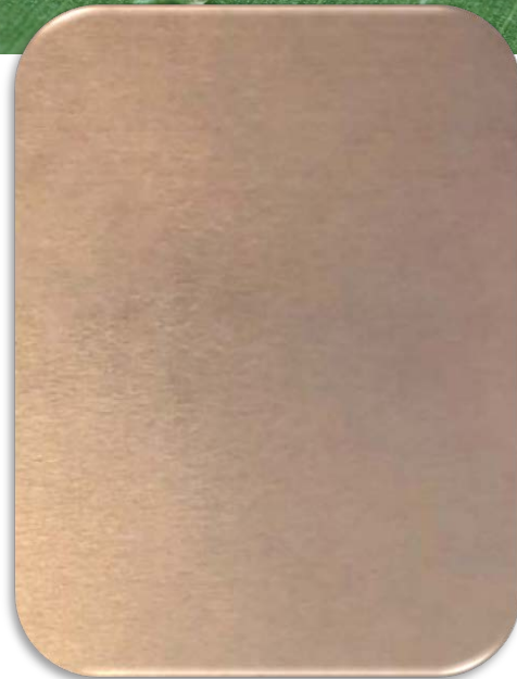
MV330 Bronze Patina Anti-Finger-Print / Easy-To-Clean