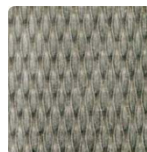
5 WL 2B geschliffen