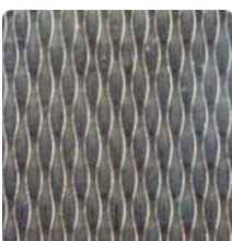
5 WL 2R