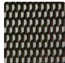
5 WL 2B Gold-VG