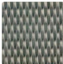
5 WL 2B gebürstet