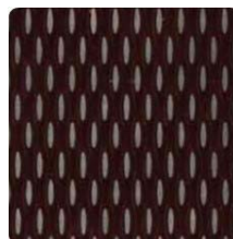
5 WL 2B Rot-RG