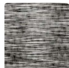
5 WL R13