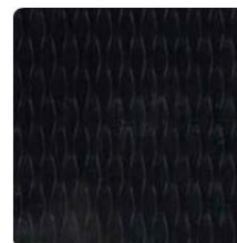
5 WL 2B Schwarz