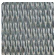
5 WL 2R HP8