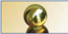
Super Acht TI